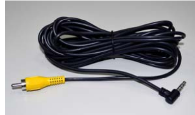
3.5 極 PHONEJACK 轉至 RCA 頭之影像線