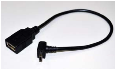
傳輸線材-mini USB 轉 USB 母頭